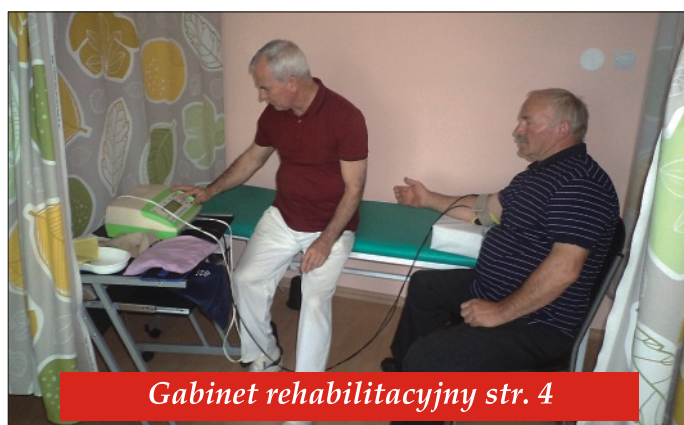
Gabinet rehabilitacyjny str. 4