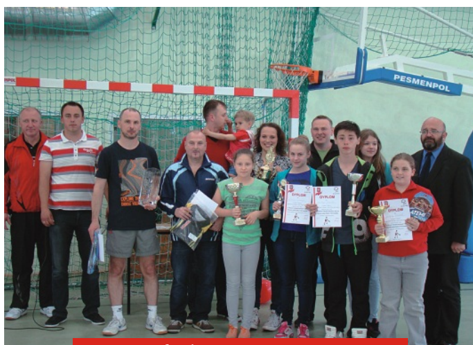
Majówka w Rojewie str.2