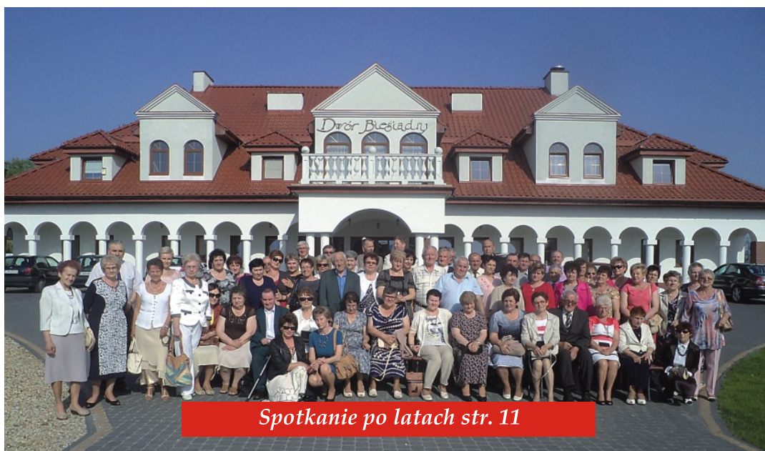
Spotkanie po latach str. 11